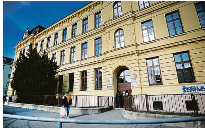
ZŠ Staňkova Od základky v Botanické je vzdálená asi 700 metrů, učí tu kolem 400 žáků. Škola je podle informací z webu zaměřená na výuku českého jazyka pro děti ze států EU i pro cizince z třetích zemí.