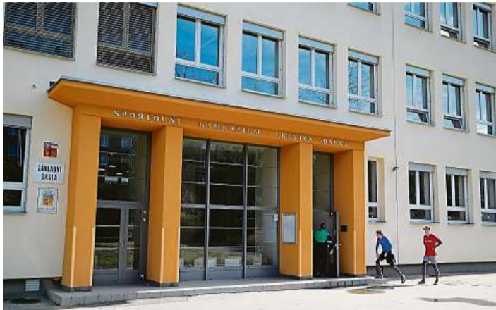
ZŠ Botanická Škola sídlí v jednom patře Sportovního gymnázia L. Daňka. Kvůli stísněným podmínkám jeho zřizovatel, Jihomoravský kraj, začal s královopolskou radnicí jednat o výpovědi.